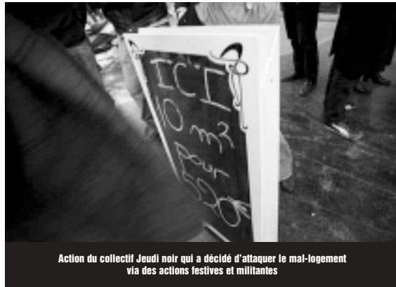
Action du collectif Jeudi noir qui a décidé d'attaquer le mal-logement via des actions festives et militantes

LE «NETTOYAGE-HÉBERGEMENT D'ÉTÉ». La direction de la cité-U se sert des vacances d'été chaque année pour mettre des étudiants à la rue. L'AGEN dénonce le fait qu'elle recoure à des prétextes les plus variés et hallucinants les uns que les autres pour faire cela. «Il faut faire de la place