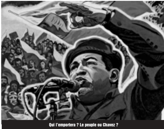
Qui l'emportera ? Le peuple ou Chavez ?

Là où les organisations paysannes occupent les terres privées laissées en friche pour les cultiver, l'Etat vénézuélien se désolidarise. Il a ainsi abrogé un article de la réforme agraire qui autorisait les paysans pauvres à occuper les terres qui pouvaient faire l'objet d'une expropriation. De plus, l'Etat ne protège pas les organisations paysannes contre les nervis des propriétaires terriens : 150 paysans ont ainsi été tués ces dernières années. La réforme agraire de Chavez n'est pas un appui aux luttes des paysans pauvres mais un «don» de l'Etat pour endiguer la surpopulation et la pauvreté des bidonvilles. Il manque également aux paysans pauvres la force organisée capable de porter un véritable projet révolutionnaire de réforme agraire basée sur l'expropriation sans indemnisation des terres des latifundistes. La Coordination Nationale Agricole Ezequiel Zamora (CANEZ) et le Front Ezequiel Zamora (FEZ),