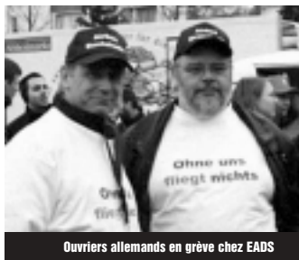
Ouvriers allemands en grève chez EADS

En ce qui concerne les subventions, Airbus reste extrêmement discret. Comme s'il avait quelque chose à cacher. C'est pour-