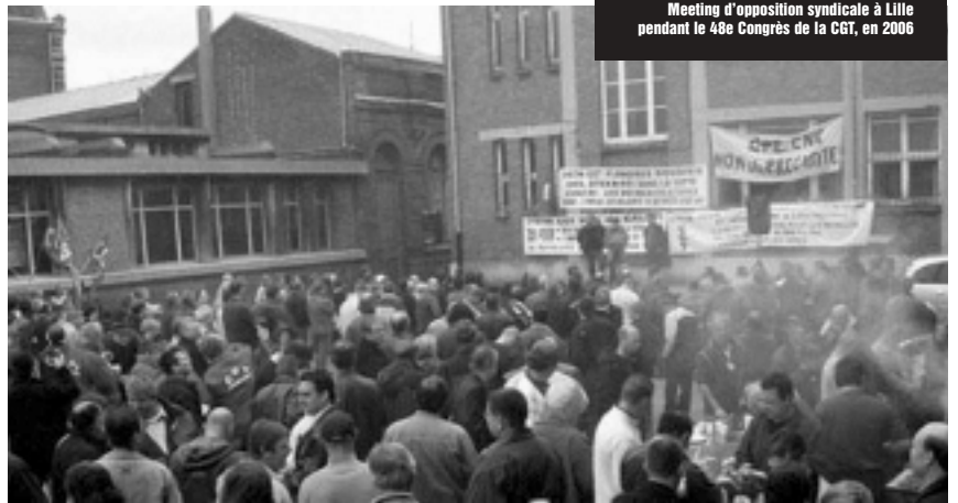
Meeting d'opposition syndicale à Lille pendant le 48e Congrès de la CGT, en 2006

Le syndicalisme est indissociable de l'action de masse, de la recherche de la solidarité de toute la classe, pour les mêmes droits pour tous. La solidarité doit se réaliser tout particulièrement avec les fractions les plus fragiles (privés d'emploi, précaires, intérimaires, salariés de la sous-traitance,