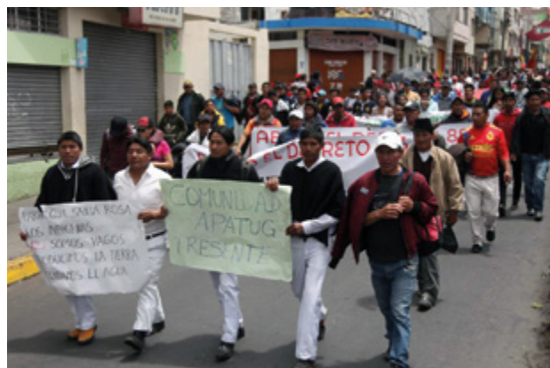
Marche dans la province de Cotopaxi. Sur la banderole : « Paroisse Santa Rosa. Nous indiens, ne sommes pas des fainéants. Nous produisons la terre, nous protégeons l'eau » .....

Mais il se confirme que le mouvement indien, qui est pour l'essentiel un mouvement paysan pauvre, est dans la phase actuelle la force principale de la révolution en Équateur : sans lui et la puissance de son soulèvement organisé, le président n'aurait pas cédé. Cela dit, il faut se méfier des interprétations indigénistes qui font du « mouvement indien » ou « indigène » un tout unifié. Les nationalités sont elles-mêmes traversées par des contradictions de classe, accentuée par le développement de l'Équateur en pays capitaliste dominé. Une fraction commerçante est devenue tout à fait bourgeoise et exploite sans vergogne les communautés locales,