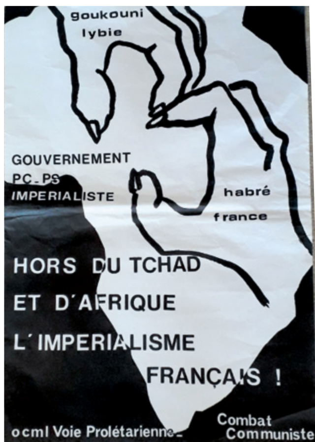
Affiche OCML-VP (1981 ?)

Parler de la présence de l'armée française en Afrique, des ventes d'armes est un sujet plutôt tabou, pourtant la classe ouvrière n'oublie pas ses traditions. Le 28 mai de cette année, les dockers de Marseille ont refusé de charger un cargo emportant des armes pour l'Arabie Saoudite, qui devait servir dans le conflit au Yémen.