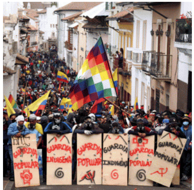
Auto-organisation des révoltés sur les barrages face à la police

On peut donc s'attendre à de nouveaux soubresauts. D'ailleurs, le président Lenin Moreno agite déjà le