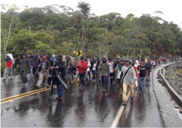
Les communautés shuars marchent sur Quito.

Après négociation avec les organisations indiennes regroupées dans la CONAIE (voir plus loin), le gouvernement annonce le retrait du décret 883 qui supprime la subvention aux combustibles et donc la hausse de leur prix, tout en annonçant vouloir « procéder immédiatement à l'élaboration d'un nouveau décret exécutif qui permette une politique de subventions aux carburants, avec une approche intégrée, avec des critères de rationalisation, de ciblage et de sectorisation, afin de s'assurer qu'elles ne sont pas destinées à des personnes disposant de ressources économiques plus importantes ou à des trafiquants de carburant » (article 2 du décret 894 du 14 octobre). Autrement dit, la vigilance s'impose pour l'avenir et le risque de coups fourrés une fois le mouvement arrêté est important.